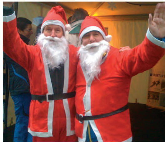
Fröhliche Adventszeit! – 2 Ski-Nikos vom Nikolauf anlässlich des FIS Skilanglauf Weltcups 2009